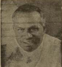
திரு மீனவரை காரணவிரை

கொழும்பு, செப். 7 அரசுக்கு தொண்டா ஆதரவு நாடாளுமன்றில் அறிவிக்கப்பட்டது. (9-8)