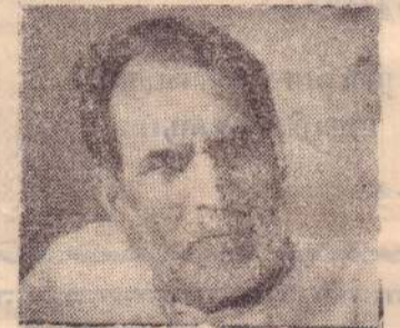
நேற்றுக் காலை பதவி ஏற்றார்.

புதுடி, நவ. 11 இந்தியாவின் ஒன்பதாவது பிரதமராக திரு. சந்திரசேகர்