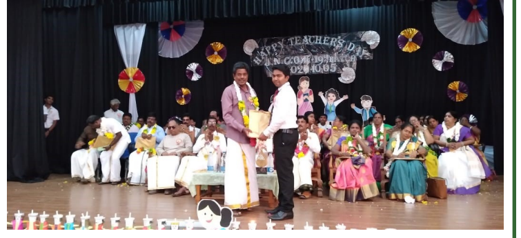
ஆசிரியர் தினத்தில் மாணவர்களினால் கௌரவிக்கப்பட்ட வேளையில்...