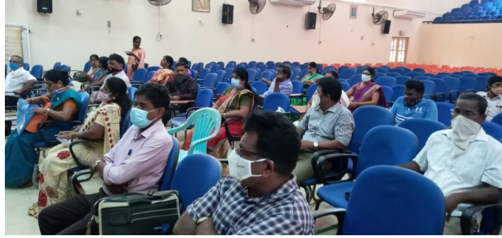
விரிவுரையாளர்களுடனான கலந்துரையாடல் ஒன்றில்...