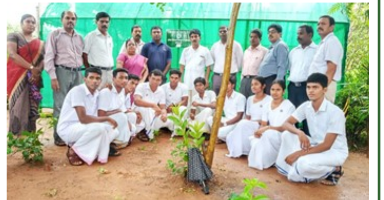
கல்லூரியில் பச்சை வீடு அமைக்கப்பட்ட தருணத்தில்...