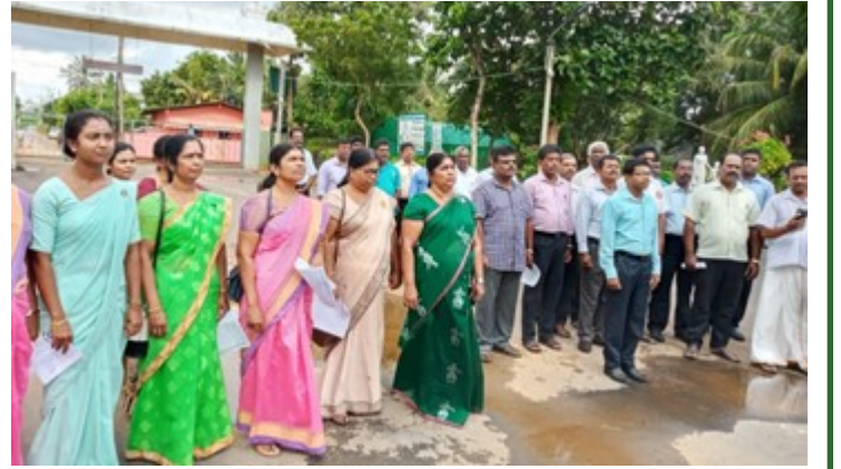
தேசியக் கொடிக்கு மரியாதை செய்யும் தருணம்...