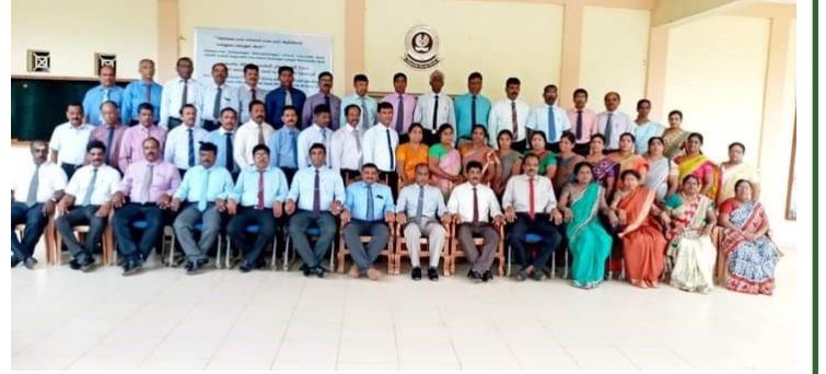
ஆசிரிய கல்வியின் ஆணையாளர் மற்றும் விரிவுரையாளர் குழுத்தினருடன்...