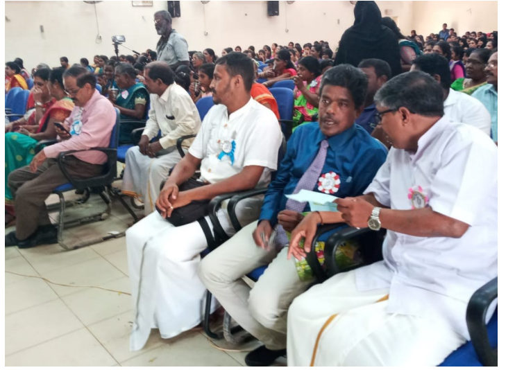
சர்வதேச ஆசிரியர் தினம் ஒன்றில் மாணவ ஆசிரியர்களினால் கௌரவிக்கப்பட்ட தருணம்!