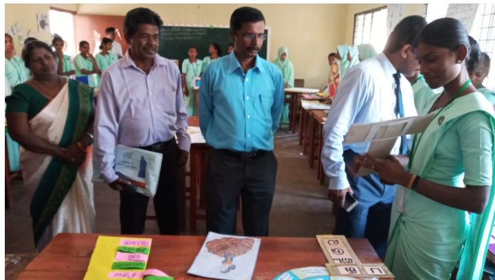
ஆரம்பப் பிரிவு மாணவ ஆசிரியர்களின் கண்காட்சியைப் பார்த்து ஆலோசனை வழங்கும் தருணத்தில்....