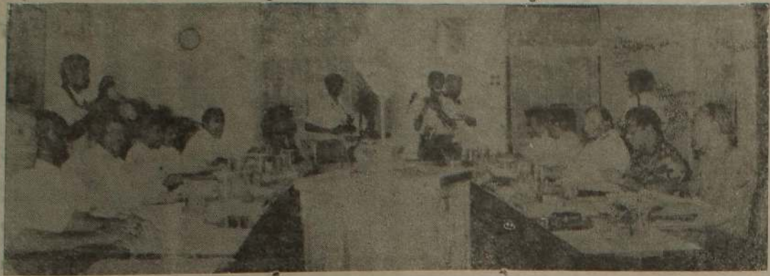
கடந்த சனியன்று யாழ்ப்பாணத்தில் நடந்த முன்றாம் கட்ட பேச்சுவார்த்தையில் கலந்து கொண்ட அரச தரப்பு பிரதிநிதிகளும், விடுதலைப் புலிகள் பிரதிநிதிகளும் பேச்சுவார்த்தை மேசையில் நேர் எதிராக அமர்ந்திருக்கும் காட்சி.