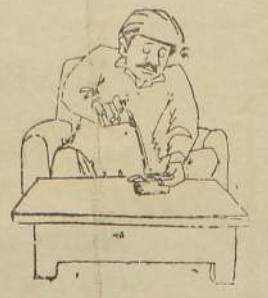
முன்னே தெரிந்திருந்தே இந்தக் கதி என்றால்.....?