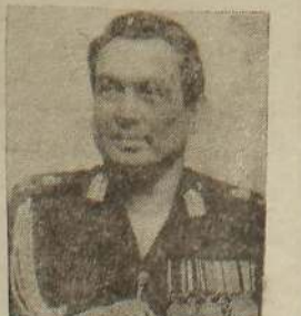
நேர்மையான முறையில் நடந்து கொள்ளுகிறார்

எனவே துருப்பினர் வசதியான நிலையில் இருந்து கொண்டே எதிர் தாக்குதல்களை நடத்தியுள்ளனர். இவ்வளவு வசதியில் இலங்கை வடக்கு கிழக்கில் உள்ள படைவீரர்கள் துருப்பினர் வசதியான நிலையில் இருந்து கொண்டே எதிர் தாக்குதல்களை நடத்தியுள்ளனர். இவ்வளவு வசதியில் இலங்கை வடக்கு கிழக்கில் உள்ள படைவீரர்கள் துருப்பினர் வசதியான நிலையில் இருந்து கொண்டே எதிர் தாக்குதல்களை நடத்தியுள்ளனர். (ஐ-4)