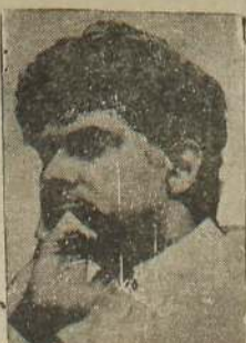
குறித்து பதிலளிப்பதற்காகவே இதை செய்தியாளர் மாநாட்டை அவர் கூட்டியிருந்தார்.