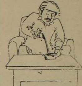
சம்பளம் கைக்கு வந்து கிடைச்சதான் பாருங்கோ நிச்சயம்...! ஜனவரி என்டா எந்த ஜனவரியைச் சொல்லுகின்றோம்...?

வண்டனில் உள்ள விடு [8 ஆம் பக்கம் பார்க்க]