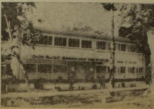
இலங்கை வங்கியின் யாழ்ப்பாண மேந்தரக் கிளையின் கம்பீரத் தோற்றம்