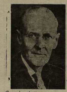
ரோட்டரியின் ஸ்தாபக: சீபால் ஹரிஸ் (PAUL HARRIS)

25,000க்கு மேற்பட்ட ரோட்டரிக் கழகங்களில் அங்கம் வகிக்கிறார்கள். இக் கழகங்கள் வாராந்தம் மதிய உணவின் போது அல்லது இரவுணவின் போது கூடுகின்றன. சிலவேளைகளில் எண்பது உணவின் போதும் கூடுகின்றன. கழகத்தின் செயற்பாட்டை நடத்துவது, அதன் சேவைத் திட்டங்களை விவாதிப்பது ஒரு நிலையான பங்களிப்பை வழங்கியதால் 1926 ஆம் ஆண்டு நினைவில் நிற்கும் ஆண்டாக விளங்குகிறது. ரோட்டரி அமைப்பானது சேவையை நோக்கமாகக் கொண்ட பாரிய தொண்டு நிறுவனங்கள் பலவற்றுக்கும் முன்னோடியாக அமைந்து குறிப்பிடத்தக்கது. 1915 இல் உருவான ஒப்பிமிஸ்ட் இசை நூல்கள், 1919 இல் உருவான பென்சைன் தொண்டர் அமைப்பான டொரா இசை நூல்கள், 1915 இல் உருவான ஒப்பிமிஸ்ட் இசை நூல்கள், 1919 இல் உருவான லயன்ஸ் குளியல், 1919 இல் உருவான ஒப்பிமிஸ்ட் இசை நூல்கள், பென்சைன் தொண்டர்