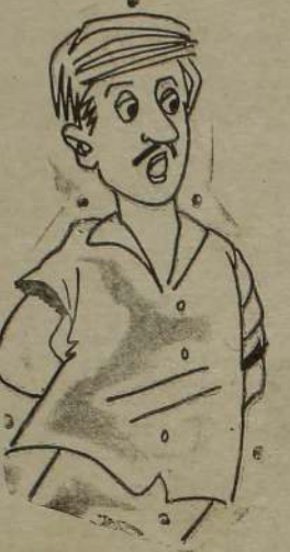
நேயாளி வார்ட்டில்... நேசம்மா வீட்டில்...