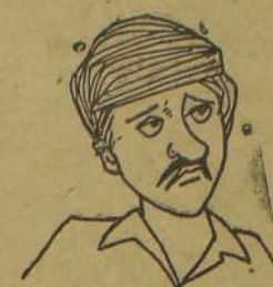
அப்ப... தை பிறக்க வழி பிறக்குது போல...!