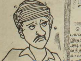
பல நாள் திருட்டு செய்து அம்பிடுவான் என அடையாளம் காணப்பட்டிருந்தது.

செச்சேனிய தலைநகர் குறொஸ்னி தமது கட்டுப்பாட்டில் வந்திருப்பதாக ரஷ்ய பாதுகாப்பு அமைச்சர் அறிவித்திருக்கிறார். செச்சேனிய ஜனாதிபதியின் மாணிக்கைய தமது கட்டுப்பாட்டில் கொள்வனவுத் தரவுப் படைகள், நகர மையத்தில் இருந்து செச்சேனிய வீரர்களை வெளியீயற்றி விட்டதாக ரஷ்ய பாதுகாப்பு அமைச்சர் அறிவித்திருக்கிறார். செச்சேனிய ஜனாதிபதி ருடையோவால் எங்கு இருக்கிறார் என்று குறித்து தகவல்கள் வெளியாகவில்லை.