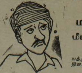
அப்ப இயற்கையும் எங்களுக்கு சதி செய்யுது பாருங்கோ...! ஐ. தே. க. ஆட்சி முறைகேடுகள்:

கொழும்பு, ஜன. 20 கடந்த அரரிள் காலத்தில் இடம்பெற்ற அதிகார துஷ்பிரயோகம், குழுவின் அமைப்பை குறித்து விசாரணை செய்ய விசேட ஜனாதிபதி ஆணைக்குழு விளையவில்லை. (6 ஆம் பக்கம் பார்க்க)