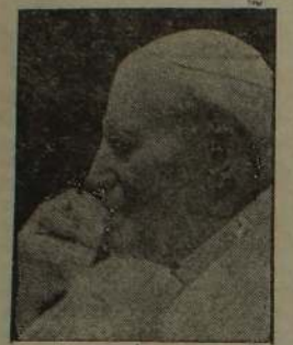
அருள்பெயர் சின்னப்பர் புனிதர் நிலையை அடைய உலகம் முழுவதிலும் புனிதராகக் கணிக்கப்படும் நிலை பெற - இன்னும் பல புதுமைகள் நடைபெறவேண்டும். முக்கியத்துவம் வாய்ந்தது திருத்தந்தையின் இலங்கை வருகை இலங்கை நாட்டு வரலாற்றிலும், கத்தோலிக்க திருச்சபை சரித்திரத்திலும் மிகவும் முக்கியம் வாய்ந்ததாகும். ஏறக்குறைய 95 கோடி உலகக் கத்தோலிக்க மக்களின் ஆன்மீகத் தலைவராக, உரோமாபுரியின் ஆயிராக, வத்திக்கான் நகரத்தின் தலைவராக, புனித இராபர்ட் பின் 284 ஆவது வாரிசாக திருத்தந்தை விளங்குகிறார். "முன்று திருத்தந்தையர் களின் வருடம்" என அழைக்கப்படும்

பர் என்ற பெயரிட்கேற்ப அவரின் பணியும் வாழ்வும் அமைந்துள்ளன. புனித அருள்பெயர், யோசவால் அதிகம் அன்பு செய்யப்பட்டவர். பல திருமடல்களை எழுதினார். இரண்டாவது அருள்பெயர் சின்னப்பரும் யோசவால் அதிக அன்பு கொண்டவராக அனைத்து திருமடல்கள் எழுதி உள்ளார். புனித சின்னப்பரின் வேதபோதகப் பயணங்களைப் போல் இவரும் தமது 16 ஆண்டு கால ஆட்சியில் 63 வேதபோதகப் பயணங்களை மேற்கொண்டுள்ளார் தமது 63 வது பயணத்தில் பிலிப்பைன்ஸ், பாப்புவாசினி, அவுஸ்திரேலியா, இலங்கை ஆகிய நாடுகளுக்குத் தம் பயணத்தை மேற்கொண்டுள்ளார். "ராமஸ்" சஞ்சிகை சமாதானத்தின் தூதுவராக