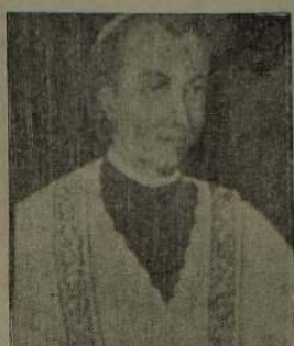
யோசேவ்வாஸ் வேண்டுமென்ற அவாவினால் துண்டப்பட்டார். காலப் போக்கில் ஆபத்து நிறைந்த தமது திட்டத்தை நிறைவேற்ற வழியைக் கண்டு கொண்டார். பல அபாயங்களின் தாண்டியும் சொல்வற்றகரிய இன்னல்களை அனுபவித்தும் அடிமை ஒருவனைப் போல் மாறவேடம் தாங்கி, யாழ்ப்பாணத்தை வந்தடைந்தார். அது 1687 ஆம் ஆண்டின் நடுப்பகுதி, யாழ்ப்பாணப் பட்டணத்தில் சில ப்ரமாணிக் கமான கத்தோலிக்கரை பெருமுயற்சி எடுத்த கண்டு பிடித்தார். காரணம், அந்நாட்களில் தண்டனைச் சட்