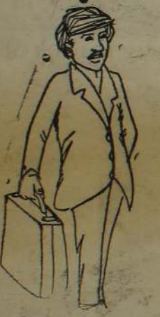
பழைய பக்கவிட்டாடல் தொடங்கி விட்டினம் பாருங்கோ.....!