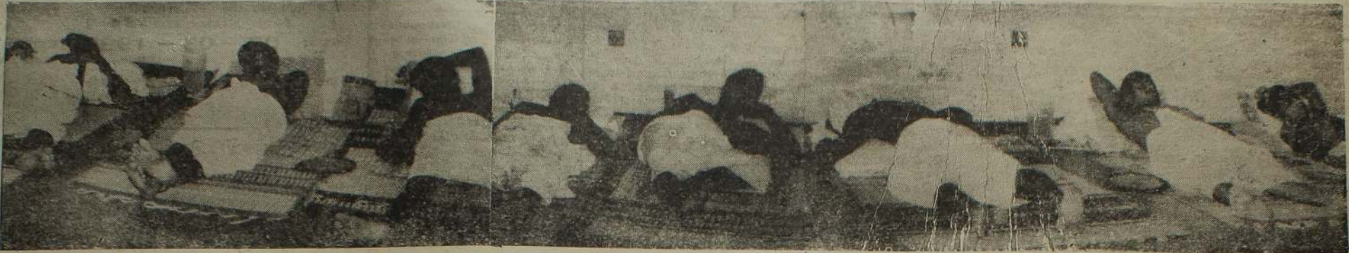
உண்ணாவிரதம் மேற்கொண்டு வரும் யுத்தக் கைதிகள் நான்காவது நாளை நேற்று சிங்கப்பேட்டை சேர்வுற்ற தீவாயில் படுத்தப்படுகையில் கிடக்கும் காட்சி. (ஐ)

சுடர் 10 திருவள்ளூர் ஆண்டு 2026 மாசி 21 ஞாயிற்றுக்கிழமை (05 - 03 - 1995) UTHAYAN A Lively National Tamil Daily கதிர் 98