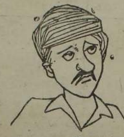
அப்ப... வாத்தியமாரின் தரம் அறியவும் டெஸ்ட் வைப்பினமோ...