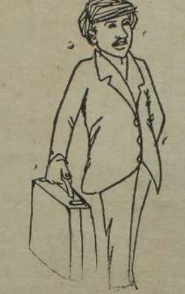
இப்பவே குடு உப்பிடி எண்டா, அடுத்த மாசத்திலை நிலைமை எப்படியோ?

புதிலைத் தருவதற்கு அரசுக்கு தமிழீழ விடுதலைப் புலிகளின் தலைவர் திரு. வே. பிரபாகரன் காலக்கெடு விதித்திருப்பதை அடுத்து—