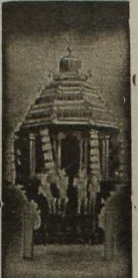
மரபைத் தழுவிவதற்கும் இரட்டை முக பத்திரிகை மீக்கப்பட்டதாகவும் தனிச் சிற்பக் கலைச்செய்தல் மட்டுமே கலாமோகன் பெருமானின் திருவருள் வழி செய்தது.