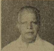
இராமநாதன் கல்லூரிக்கு உபகரணங்கள்

ஆகிரிபிந்து ஆண்டிரண்டு சென்னுலும் எம். ஆபுன் உள்ளவரை நாம் உம்மா ஹிபாம். உமது ஆன்மா சாத்தியமடைய என்றும் இறைவனை பிரார்த்திக்கும்: தாய், தந்தை, சகோதரர், சகோதரிகள் மைத்துனர், மைத்துனிகள், பெருமக்கள், மருமக்கள், உற்றார், உறவினர். (8932)