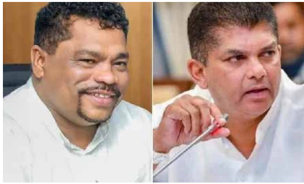
நாடாளுமன்ற உறுப்பினர்களான பியல் நிஷாந்த மற்றும்

லொஹான் ரத்வத்த ஆகியோர் முன்னர் வகித்த இராஜாங்க அமைச்சு பதவிகளுக்கு மீண்டும் நியமிக்கப்பட்டுள்ளனர். இதன்மூலம், இரு நாடாளுமன்ற உறுப்பினர்களுக்கும் தங்களது இராஜாங்க அமைச்சு பதவிகளில் தொடர்ந்து பணியாற்றுவார்கள் என ஜனாதிபதி ஊடக பிறவு தெரிவித்துள்ளது.