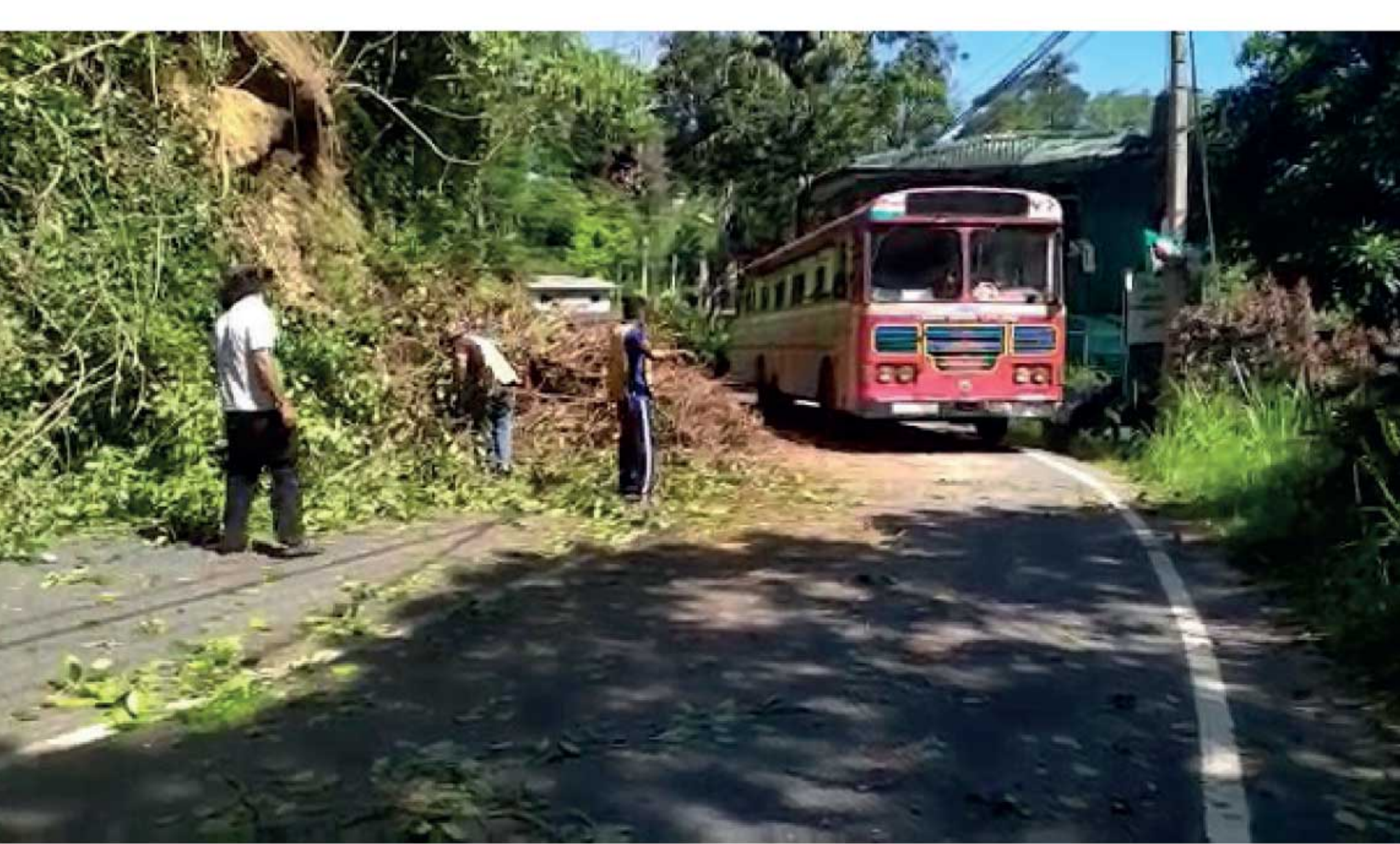
கினிகத்தேஹைணை பொலிஸார் தெரிவித்தனர். சரிந்து விழுந்துள்ள மண்மேடு மற்றும் கற்களை அகற்றும் பணிகள், வீதி அபிவிருத்தி அதிகார