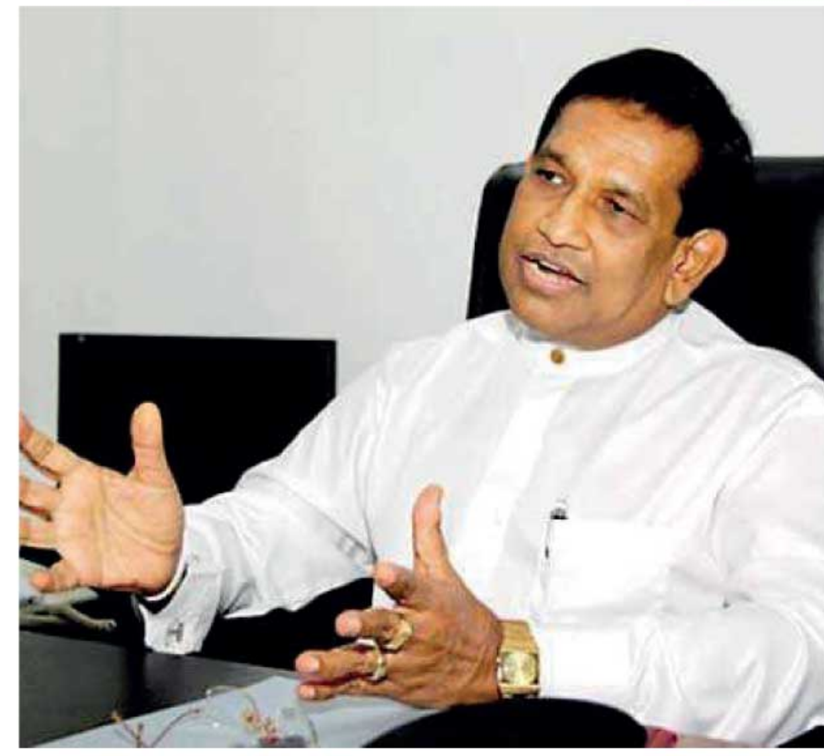
பெரும்பான்மையை விட, அதிகமான பாராளுமன்ற உறுப்பினர்களின் ஆதரவு உள்ளது எனவும் கூறினார்.

கொண்டுள்ளனர். ஸ்ரீ லங்கா பொதுஜன பெரமுனவுக்கு 157 பாராளுமன்ற உறுப்பினர்கள் உள்ள நிலையில், 70 சதவீதமானவர்கள் கூட மஹிந்தவுக்கு ஆதரவளிக்கவில்லை. அரசாங்கத்திலிருந்து விலகியுள்ள கட்சிகளுடன் கலந்துரையாடி அரசாங்கத்துக்கு எதிரான நம்பிக்கையில்லாப் பிரேரணையை ஐக்கிய மக்கள் சக்தி பாராளுமன்றத்தில் கொண்டுவர உள்ளது. இந்த நம்பிக்கையில்லாப் பிரேரணை தொடர்பில், அனைவருடன் கலந்துரையாடி இணக்கப்பாடு எட்டப்பட்டுள்ளது. எமக்கு மூன்றிலிரண்டு