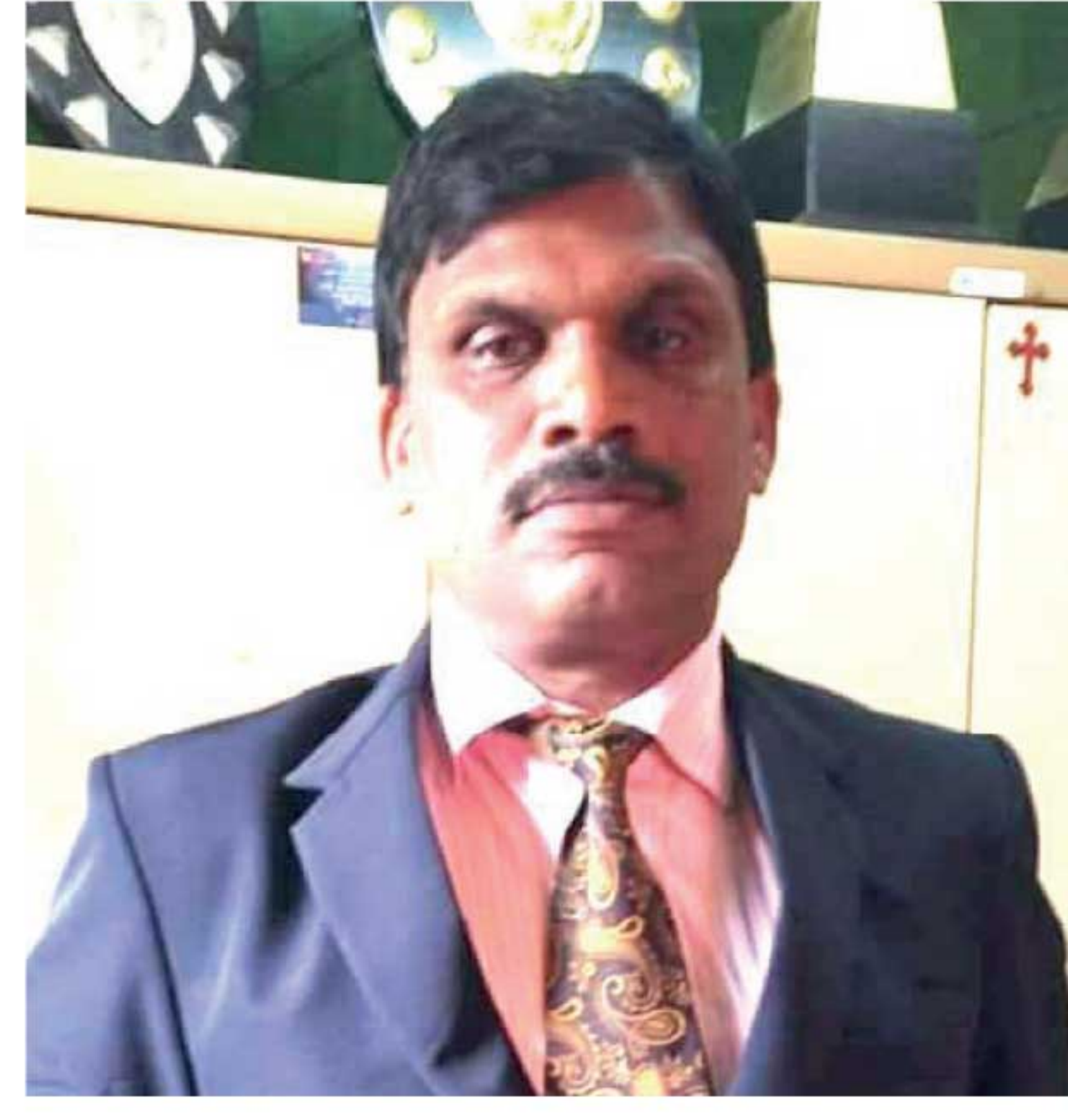
சுகவீன விடுமுறை போராட்டத்தில் ஈடுபடுமாறு வேண்டுகோள் விடுத்துள்ளார்.

எதிர்ப்பு தெரிவித்து நாடளாவிய ரீதியில் பல்வேறு விதமான போராட்டங்களில் மக்கள் ஈடுபட்டு வருகின்றனர். இப்போராட்டங்களுக்கு வலுச்சேர்க்கும் வகையிலும் இந்த அரசாங்கம் மக்களின் போராட்டங்களுக்கு செவ்வாய்த், மக்களின் கோரிக்கையை நிறைவேற்ற வேண்டும். எனவே எமக்கு உடனடி தீர்வை அரசு வழங்க வேண்டும் எனக் கோரி எமது எதிர்ப்பை வெளிக்காட்ட அதிபர்கள், ஆசிரியர்கள் அனைவரும்