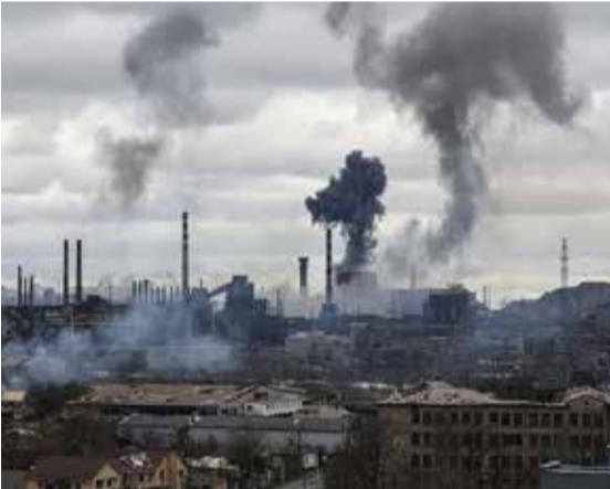
ரஷ்யா இது தொடர்பாக வெளியிட்ட உள்ள அறிக்கையில் குறிப்பிட்டுள்ளது.

உக்ரைனின் மரியுபோல் நகரில் தங்களால் முற்றுகையிடப்பட்டுள்ள, அலோவ்ஸ்டல் இரும்பு ஆலையில் பதுங்கியுள்ள உக்ரைன் படையினர் வெள்ளைக்கொடியை ஏற்றுவதன் மூலம் போர் நிறுத்தத்தை ஆரம்பித்து வைக்க வேண்டும் என்றும் ஆலையிலிருந்து பொதுமக்கள் வெளியேறுவதற்காக போர்நிறுத்தம் மேற்கொள்ளத்தயாராக இருப்பதாக கூறியுள்ள