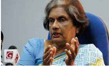
லாளர் ஆகியோர்கட்பாயம்பதவி விலக வேண்டும்” - என்றார்.

ஸ்ரீலங்கா சுதந்திரக் கட்சியின் சிரேஷ்ட போஷகர் பதவியில் நான் நீடிக்கின்றேன். என்னை எனும் பதவி நீக்கம் செய்ய முடியாது. கட்சியில் உள்ள கள்வர்களை விரட்டினால், கட்சியைக் கட்டியெழுப்ப நான் தயார். தற்போதைய தலைவர் மற்றும் பொதுச்செயலாளர் ஆகியோர்கட்பாயம்பதவி விலக வேண்டும்” - என்றார்.