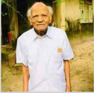
கட்சியின் உடுப்பிட்டி கிளைத் தலைவராகவும் செயற்பட்டார். (அ)

1915ஆம் ஆண்டு பிறந்த அவர், இலங்கை தமிழ் அரசு