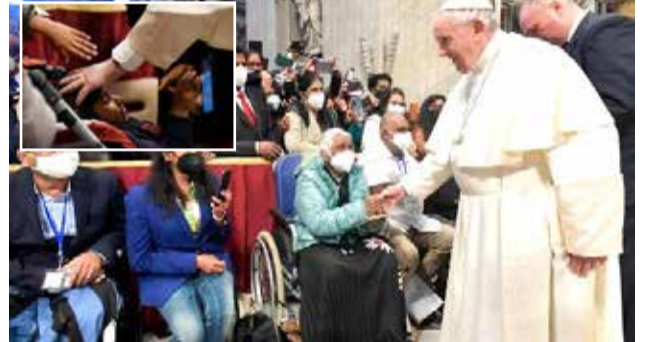
உயிர்த்த ஞாயிறு தாக்குதல்களில் பாதிக்கப்பட்டவர்களுடன் இணைந்து பரிசுத்த பாப்பரசர் நேற்று வத்திக்கானில் விசேட ஆராதனை நடத்தி அவர்களை ஆசீர்வதித்தபோது....

கொழும்பு, ஏப்ரல் 26 எதையும் எதிர்கொள்வதற்கு தயாரான நிலையிலேயே பிரதமர் மஹிந்த ராஜபக்ஷ இருக்கிறார் என்று அவருக்கு மிக நெருக்கமான வட்டாரங்கள் தெரிவித்தன. இதனிடையே, நேற்று மாலை ஆரம்பமான அமைச்சரவைக் கூட்டத்தில் பிரதமர் மஹிந்த ராஜபக்ஷவும் பங்கேற்றிருந்தார். இந்தக் கூட்டத்தில், அவர் 20ஆவது திருத்தச் சட்டத்தை ஒழித்து 19ஆவது திருத்தச் சட்டத்தை மீளவும் அமுல்படுத்துவதற்கான முன் மொழிவுகள் அடங்கிய ஆவணங்களுடன் சென்றிருந்தார். (இந்த செய்தி எழுதப்படும்போது கூட்டம் நிறைவுபெறாமையால் அவரின் சமர்ப்பணத்தை உறுதி செய்ய முடியவில்லை.) இந்நிலையிலேயே, பிரதமர் மஹிந்த ராஜபக்ஷ பதவி விலகுவார் என்று தகவல்கள் வெளியாகியிருந்தன. இந்தக் கருத்துக்களை பிரதமரின் அலுவலக அதிகாரிகள் மறுத்திருந்தனர். இந்நிலையிலேயே எதையும் 15