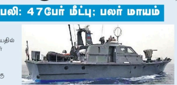
ஐரோப்பா நாடுகளைச் சேரக்கூடக் கொண்டுள்ளது. அவர்களை தலைநகரமான பெசுரா போயனான் உட்பட உயிரிழந்த அகதிகள் படகின் மீது மோதியதாக தெரிவிக்கப்படுகிறது. இதில் அகதிகள் சேர்த்து நிறைவுகொண்ட கடல் மீது மோதியது.