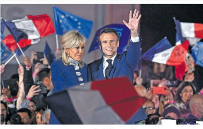
பெற்றவர்களாவார். ஜனாதிபதியின் பதவிக்கானும் அடுத்த மாதம் நிறைவடையவிருந்த நிலையில், கடந்த 10ஆம் திதி வாக்குப் பதிவு

பிரான்ஸ் ஜனாதிபதி தேர்தலில் தீவிர வலதுசாரி கொள்கையை கொண்ட மரின் லெபென் (Marine Le Pen) தேற்கூடியது. இம்மாணுவல் மெக்ரொன் (Emmanuel Macron) இரண்டாவது முறையாகவும் பிரான்ஸ் ஜனாதிபதியாக தெரிவு செய்யப்பட்டுள்ளார். பிரான்ஸ் ஜனாதிபதி தேர்தலில் 20 ஆண்டுகளில் இரண்டாவது முறையாகவும் வெற்றிபெற்ற முதல் பிரான்ஸ் ஜனாதிபதி இம்மாணுவல் மெக்ரொனாவார். 5 ஆண்டுகளுக்கு ஒரு முறை நடைபெறும் பிரான்ஸ் ஜனாதிபதி தேர்தலில் அந்தமட்டில் மட்டுமன்றி பிரேன்களில் வசிக்கும் பிரெஞ்சு ஆயுசிமம் பெற்றவர்களும் வாக்களித்தனர்.