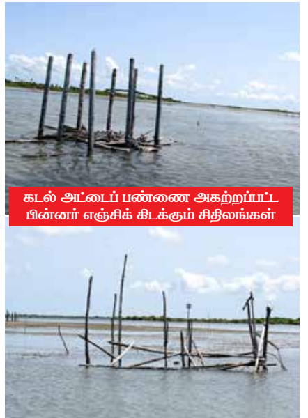
கடல் அட்டைப் பண்ணை அகற்றப்பட்ட பின்னர் எஞ்சிக் கிடக்கும் சிதிவங்கள்

இந்த நிலைமையில் தற்போது இலங்கையில் நிலவும் பொருளாதார நெருக்கடியினால் எரிபொருளை பெறுவதில் உள்ள சிரமத்தின் காரணமாக இந்தப் பண்ணையைப் பராமரிக்க முடியாத நிலைமை ஏற்பட்டிருப்பதாகக் கூறப்படு