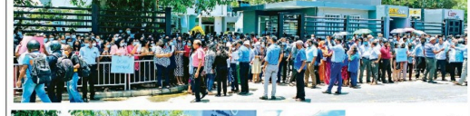
இரத்தமாலையில் அமைந்துள்ள தேயி நீர்வழங்கல் வடிகாலை மையப்புச் சபைக்கு முன்னால் சபை ஊழியர்களால் நேற்று ஆர்ப்பாட்டமொன்று முன் டெருக் கப்பட்டது.

இதேவேளை, வீடியோ கேம் விளையாடி பல இளைஞர்கள் இத்தியாவில் உயிர் மாய்த்தமை குறிப்பிடத்தக்கது.