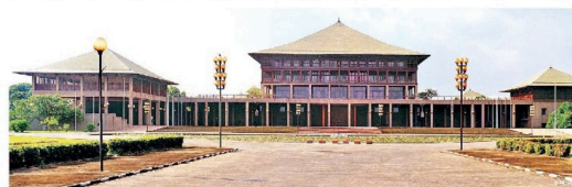
அமைப்பதற்கான பணிகளை ஜப்பானிய நிறுவனமான பெறாப்பேற்றிருந்தது.

இலங்கை நாடாளுமன்றம் ஸ்ரீ ஜயவர்தனபுர கோட்டேயிலுள்ள தற்போதைய கட்டடத்துக்கு கொண்டுவரப்பட்டு இன்றுடன் (29) 40 வருடங்கள் பூர்த்தியடைகின்றன.