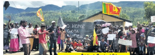
நாலுடியா வேல்டல் தோட்டத்தில்...