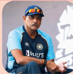
கிரிக்கெட் உலகின் நட்சத்திர துடுப்பாட்ட வீரர்களில் ஒருவரான வீரர் கோஹ்லி கடந்த 2 ஆண்டுகளை டீபார்கில் இல்லாமல் தினரிவரும் நிலையில், நடப்பு ஐ.பி.எல்.

தொடரிலும் ஓட்டங்கள் குவிக்க முடியாமல் திரிந்துவருகிறார். 8 போட்டிகளில் வெறும் 119 ஓட்டங்களை மட்டுமே அடித்த வீரர் கோஹ்லி, ராஜஸ்தான் அணிக்கு எதிரான போட்டியில் ஓய்வளிக்க இறங்கியிருக்கிறார். ஆனால், அதிலும் 9 ஓட்டங்களில் ஆட்டமிழக்க 9 போட்டிகளில் 128 ஓட்டங்கள் மட்டுமே அடித்துள்ளார். வீரர் கோஹ்லி தொடர்ந்து திரிவதற்கும் நிலையில், அவருக்கு சிறிய ஓய்வு தேவை என்றும் அதனால் ஐ.பி.எஸில் இருந்து ஓய்வு எடுத்துக்கொள்ள வேண்டும் என்றும் பல முன்னணி வீரர்கள் வலியுறுத்தியுள்ளனர். அந்த வரிசையில் இந்திய அணியின் முன்னணி பயிற்றுநர்ப்பாடாளரான ரவி சாஸ்திரியும் இணைந்துள்ளார்.