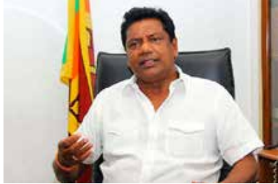
படுத்தப்பட வேண்டும் என குறிப்பிட்டு 7 முன்மொழிவுகள் சபாநாயகருக்கு குறித்த கடிதத்தின் ஊடாக அறிவிக்கப்பட்டுள்ளது.

இதேவேளை, நாட்டை மீளக் கட்டி வயமுப்புவதற்கு நாடாளுமன்றத்தின் தலையீட்டுடன் விரைவாக அமல்