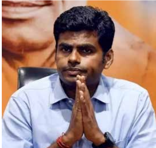
கொண்டு அண்ணாமலை வடக்கிற்கான விஜயத்தை மேற்கொள்ளவுள்ளமை குறிப்பிடத்தக்கது.

பின்னர், மே தினக் கூட்டத்தை நிறைவு செய்து