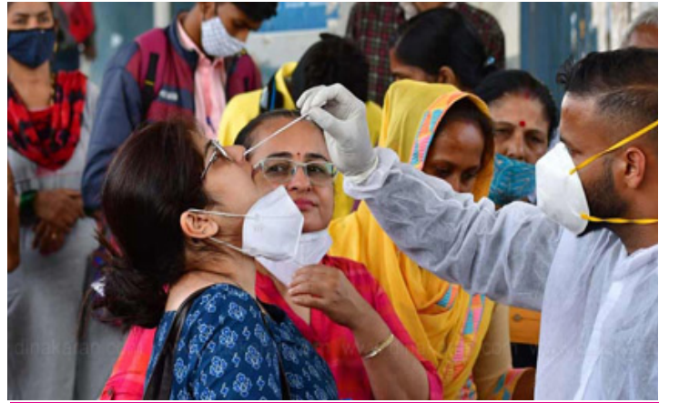
இந்தியாவில் கடந்த 24 மணி நேரத்தில் 40 பேர் தொற்றால் உயிரிழப்பு

கடிதத்தில் கையெழுத்திட்டிருப்போர் தங்களை அக்கறை உள்ள குடிமக்கள் என்று குறிப்பிட்டு இருப்பதோடு அதன் பின்னணியில் எந்த வித உள்நோக்கமும் இல்லை என கூறியுள்ளனர். முன்னாள் அரசு ஊழியர்களான தாங்கள் வழக்கம் போல இத்தகைய கடின வார்த்தைகளை பயன்படுத்துவது இல்லை என்று கூட்டிக்காட்டியுள்ள அவர்கள் அரசியல் சாசனத்தின் தனித்துவம் சிதைக்கப்படும் போது கோபம் மற்றும் வேதனையை வெளிப்படுத்த வேண்டிய கட்டாயம் ஏற்பட்டு இருப்பதாக குறிப்பிட்டுள்ளனர்.