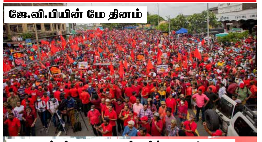
ஜே.வி.பியின் மே தினம்