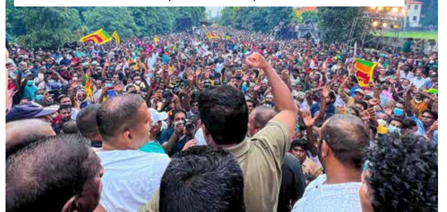
ஐக்கிய மக்கள் சக்தியின் மே தினம்