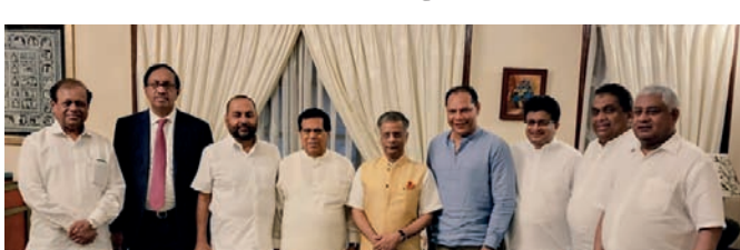
பொருளாதார, அரசியல் நிலை தொடர்பில் விரிவாக ஆராயப்பட்டுள்ளது. "இலங்கைக்குத் தேவையான ஒத்துழைப்புகளை இந்தியா தொடர்ச்சியாக வழங்கும்"

ஸ்ரீ லங்கா பொதுஜன பெரமுன அரசாங்கத்திலிருந்து விலகி சுயாதீனமாக செயற்படும் பாராளுமன்ற உறுப்பினர்கள் அடங்கிய குழு, இந்திய உயர்ஸ்தானிகர் கோபால் பாக்கேயை சந்தித்து கலந்துரையாடியுள்ளது. இதன்போது, நாட்டின் தற்போதைய