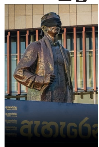
இக்கட்டுரையின் அடிப்படையிலேயே பண்டாரநாயக்கவின் உருவச் சிலைக்கு கறுப்புப் பட்டி அணிவிக்கப்பட்டதாகவும், போராட்டக்களத்தில் இளைஞர்கள் இது தொடர்பில் அவதானத்துடன் இருக்க வேண்டும் எனவும் மஹிந்த அமரவீர கேட்டுக்கொண்டார்.

இந்தச் செயற்பாடு அரசாங்கத்துக்கு எதிரான போராட்டத்தை திசை திருப்புவதற்கான முயற்சி எனவும் தெரிவித்த அவர், இந்தியாவை மையமாகக் கொண்டு இயங்கி வரும் இணையத்தளம் ஒன்று, பண்டாரநாயக்கவின் உருவ சிலை தொடர்பிலும், அவரின் கொள்கைகள் தொடர்பிலும் கேள்வி எழுப்பி, அந்த உருவச் சிலையை அழிக்க வேண்டுமெனவும் கட்டுரை ஒன்றை பிரசுரித்திருந்தது.