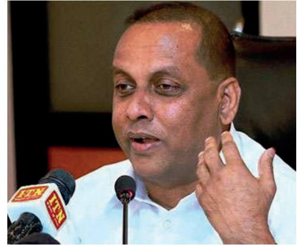
அமைக்க வேண்டும் என யோசனையை முன்வைத்தோம் எனவும் கூறினார். அரசாங்கத்திற்கு எதிராக ஐக்கிய மக்கள் சக்தியினரால் கொண்டுவரப்படும் நம்பிக்கையில்லாப் பிரேரணைக்கு ஆதரவளிப்பதற்கு ஸ்ரீலங்கா சுதந்திரக் கட்சி கட்சி தீர்மானித்துள்ளதாகவும் அவர் இதன்போது தெரிவித்தார்.

நாட்டில் ஏற்பட்டுள்ள நெருக்கடி நிலைமைகளை, அரசியலமைப்பு ரீதியாகத் தீர்த்து வைக்க வேண்டும் எனவே, தற்போதைய நிலையைக் கருத்திற்கொண்டு, சர்வகட்சிகளைக் கொண்ட இடைக்கால அரசாங்கம் ஒன்றை