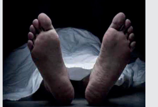
தெரிவித்தனர். இருப்பினும், தாய் அளித்த புகாரின்பேரில் பல்வேறு பிரிவுகளின் கீழ், மூன்று பேர் மீது வழக்குப் பதிவு செய்யப்பட்டுள்ளதாகத் தெரிவிக்கப்பட்டுள்ளது.

உத்தர பிரதேசம் மாநிலம், உன்னாவ் மாவட்டத்தின் பங்கர்மால் பகுதியில் முதியோர் இல்லமொன்று உள்ளது. இந்நிலையில் குறித்த முதியோர் இல்லத்தில் நேற்று முன்தினம் (30) தாயாகப் பணியில் இணைந்த யுவதியொருவர் நேற்றைய தினம் அதே முதியோர் இல்லத்தில் தூக்கில் தொங்கி உயிரிழந்துள்ளார் எனத் தெரிவிக்கப்பட்டுள்ளது. இதனையடுத்து சம்பவ இடத்திற்கு வந்த பொலிலார் குறித்த யுவதியின் சுலக்தை மீட்டு பிரதேச பரிசோதனைக்காக அனுப்பி வைத்தனர். இதற்கிடையே, தனது மகள் பாலியல் பலாத்காரம் செய்யப்பட்டு கொல்லப்பட்டதாகவும், இதன் பின்னணியில் முதியோர் இல்லத்தின் மேலாளர் இருப்பதாகவும் இறந்தவரின் தாய் குற்றம்சாட்டினார். இந்நிலையில், பிரதேச பரிசோதனை அறிக்கையில் கற்பழிக்கப்படவில்லை என்று குறிப்பிடப்பட்டிருப்பதாகப் பொலிலார்