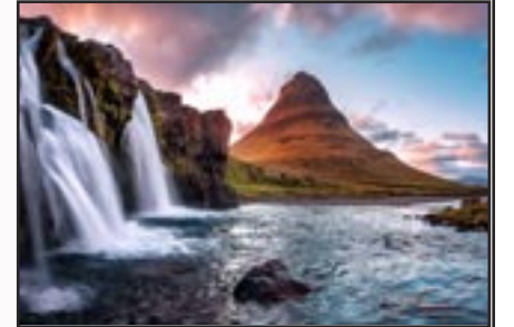
காணும் உள்ளங்களின் மனதைத் தொட்டு அவன் கொள்ளை இன்பம் தருகின்றான்

உலகல் ஒளிரும் நொய்றாகத் தனமும் வானில் உலவ் வருகின்றான் இரவின் இருளை அகற்ற ஒளியை கொடுத்து வீடியலை தருகின்றான்