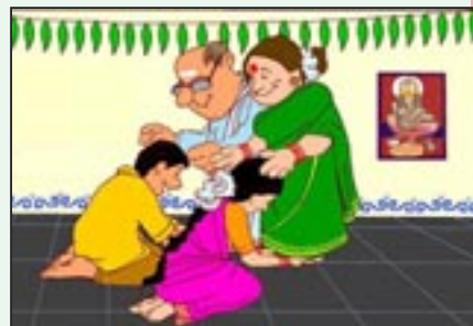
உலக பெற்றோர் தினம் ஜூன் 01, 2021

அதன் விளைச்சல் இந்தப் பிரபஞ்சத்தின் வாழ்வுக்காக நான் கொடுக்கும் உழைப்பு எனும் கருத்து இதயத்திலிருந்து