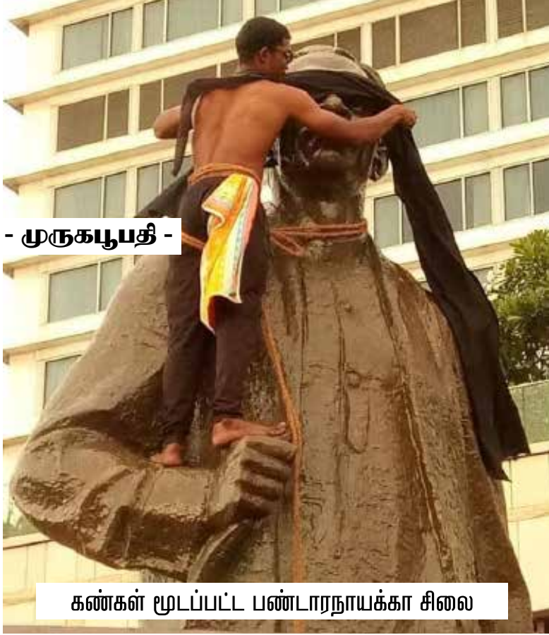
- முருகபதி -