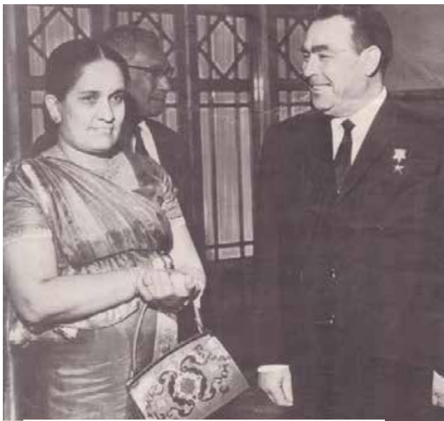
ஸ்ரீமாவோ - பிரஷ்னோவ்

அதில் ஒரு பிரம்மாண்டமான வெண்கலச் சிலை தான் காலிமுகத்தில் அமைந்துள்ளது. அதன் கண்கள் தற்போது ஆர்ப்பாட்டக்காரர்களினால் கறுப்புத்துணியினால் கட்டப்பட்டுள்ளது.