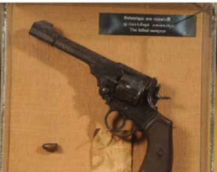
பண்டாரநாயக்காவை கொலைசெய்ய பயன்படுத்திய துப்பாக்கி