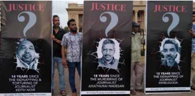
சர்வதேச ஊடக சுதந்திர (மே 03) கொழும்பில் ஊடகவிதின் மான நேற்றுமுன்தினம் யலாளர்கள்