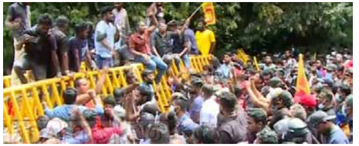
நாடாளுமன்ற நுழைவு வீதியில் ஆர்ப்பாட்டத்தில் ஈடுபட்டு வந்த பல்கலைக்கழக மாணவர்கள் மீது போலீஸின் தாக்குதல்

நாடாளுமன்ற நுழைவு வீதி ஆர்ப்பாட்டம் இடைநிறுத்தம்