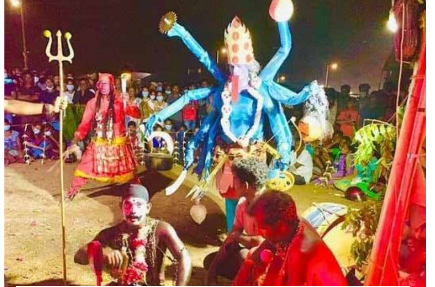
கொழும்பு - காலி முகத்திடலில் அரசுக்கு எதிராகப் பல்வேறு வடிவங்களில் போராட்டங்கள் முன்னெடுக்கப்படுகின்றன. சனியிரவு காளிக்குப் பூஜை வழிபாடுகளை மேற்கொண்டு தப்பு அடித்து, அரசுக்கு கடுமையான எதிர்ப்புத் தெரிவிக்கப்பட்டது.