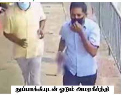
துப்பாக்கியுடன் ஓடும் அமரகீர்த்தி

நாடாளுமன்ற உறுப்பினர் அமரகீர்த்தி அத்துக்கோரளவுக் குச் சொந்தமானதாகக் கூறப்படும் வாகனம் ஒன்று நேற்று மாலை நித்தம்புவ பிரதேசத்தில் துப்பாக்கிச் சூட்டு சம்பவத்தில் ஈடுபட்டுள்ளது. நாடாளுமன்ற உறுப்பினரின் வாகனத்தில் வந்த குழு வொன்று அப்பகுதியில் கூடியிருந்த அரசாங்க