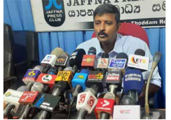
குற்றம் செய்ததற்காக 10 தொடக்கம் 26 வருடங்கள் வரை தமிழ் அரசியல் கைதிகள் சிறையில் உள்ளனர். உடனடியாக அவர்கள் விடுதலை செய்யப்பட வேண்டும். - என்றார்.

நாட்டை சூறையாடி பொருளாதாரத்தை நலிவடையச் செய்த நபர்கள் தப்பியோடக்கூடிய சூழலில் சாதாரண