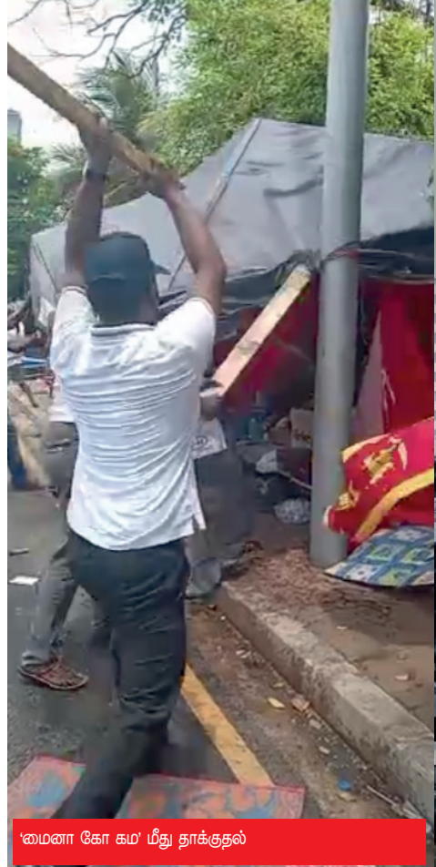
'கமனா கோ கம' மீது தாக்குதல்