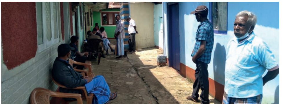
தாய் நித்திரையிலிருந்து எழும்பாததை அவதானித்த மகள், தாயின் அறையை திறக்க முற்பட்ட போது, கதவு உள்பக்கமாக மூடப்பட்டிருந்ததாகவும் பின் அயலவர்களின் உதவியுடன் அறையை திறந்து பார்த்த போது, தாய் சடலமாகக் காணப்பட்டதாகவும் மகள் தெரிவித்துள்ளார்.

அத்துடன் நேற்றுமுன்தினம் (8) காலை இவர், இராகலை பிரதேச வைத்தியசாலைக்கு சென்று மருந்து எடுத்து வந்துள்ளதான். இரவு உணவுக்குப் பின்னர் நித்திரைக்குச் சென்றதாகவும் அவரது மகள் தெரிவித்துள்ளார். நேற்று (9) காலை ஏழு மணிவரை