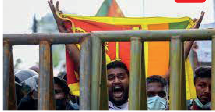
இடத்துக்கு வருகை தரவில்லை என்றும் குற்றஞ்சாட்டப்படுகின்றது. இதேவேளை, இந்தச் சம்பவத்துக்கு எதிர்ப்பு தெரிவித்து, கண்டி தேசிய வைத்தியசாலையின் பணியாளர்கள், தமது கடமைகளிலிருந்து நேற்று விலகி, வைத்தியசாலையை விட்டு வெளியேறினர்.

இந்தப் போராட்டக் களமானது, கண்டி பொலீஸ் நிலையத்திலிருந்து 100 மீற்றர் தொலைவில் அமைந்திருந்த நிலையில், சம்பவம் நடைபெற்று அரை மணித்தியாலம் செல்லும் வரை, பொலீஸார் சம்பவ