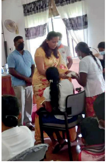
நடைபெற்ற நிகழ்வில், 24 இலட்சம் ரூபாய் நிதியுதவி வழங்கப்பட்டது.