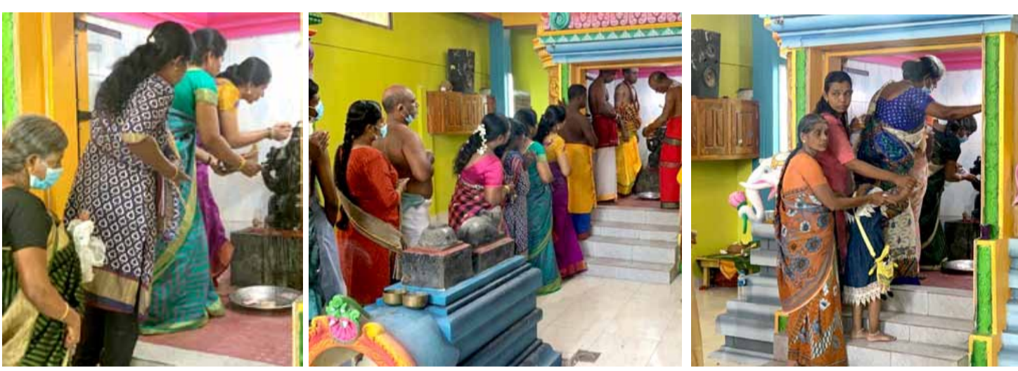
திருகோணமலை கண்டி வீதி ராஜவரோதயம் சதுக்கம் ஸ்ரீ வரசித்தி விநாயகர் திருக்கோயிலின் மகாகும்பாபிஷேகத்தை முன்னிட்டு பக்தர்கள் எண்ணைக்காப்பு சாத்தும் நிகழ்வு நேற்று இடம் பெற்ற போது.

னையிட்டபோது அவரிடமிருந்து ஹெரோயின் போதைப் பொருள் கைப்பற்றப்பட்டதாகவும் கிண்ணியா பொலிஸாரினால் ஹெரோயின் போதைப் பொருளை தம்வசம் வைத்திருந்த குற்றச்சாட்டின் பேரில் இரண்டு வழக்குகள் ஏற்கனவே அவர் மீது தாக்கல் செய்யப்பட்டுள்ளதாகவும் விசாரணைகளின் மூலம் தெரியவந்துள்ளது. கைது செய்யப்பட்ட குறித்த சந்தேகநபரை திருகோணமலை நீதிமன்றில் முன்னிலைப்படுத்த நடவடிக்கை எடுத்துள்ளதாகவும் உப்பு வெளி பொலிஸார் தெரிவித்துள்ளனர்.