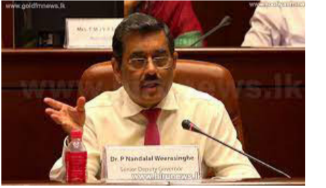
நாட்டின் பொருளாதாரம் மேலும் மோசமடையுமாம்!

இதேநேரம் தற்போதைய குழப்பமான சூழலில் எரிபொருளை எடுத்து வரும் தாங்கிகளுக்கும் தீவைக்கூடும் என்ற அச்சம் காணப்படுவதால் அதற்கான பாதுகாப்பை வழங்குமாறு படையினரிடம் கோரப்பட்டுள்ளது. அந்தப் பாதுகாப்பு கிடைத்தால் எரிபொருள் எடுத்துவர நடவடிக்கை இடம்பெறுகின்றது. - என்றார்.