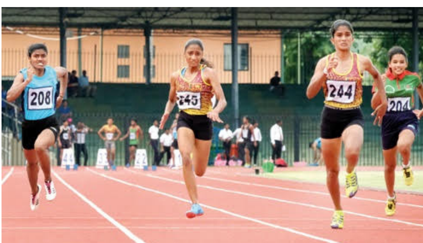
அத்துடன், இந்த ஆண்டுக்கான மெய்வல்லுநர் போட்டிகள் அனைத்தும் வழமை போன்று மாகாண மட்டத்தில் நடைபெறவுள்ளன எனவும் தெரிவிக்கிறது.