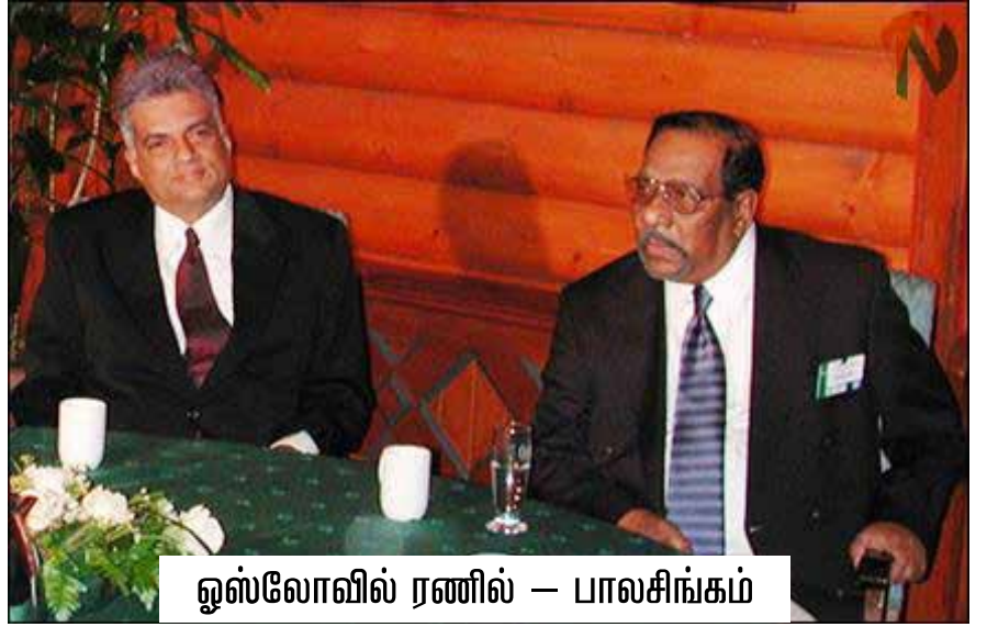
ஓஸ்லோவில் ரணில் - பாலசிங்கம்

குழுவுக்கு பிரதமர் ரணில் விக்கிரமசிங்க தலைமை தாங்கினார். சமாதானப் பேச்சுகளில் அரசுத் தரப்பில் தலைமை வகித்த அமைச்சர் பேராசிரியர் ஜி.எல். பீரிஸும், விடுதலைப் புலிகள் தரப்பில் தலைமை வகித்த மதியுரைஞர் அன்ரன் பாலசிங்கமும் மேற்படி உதவி வழங்கும் நாடுகளின் ஒஸ்லோ முன்னாயத்தக் கூட்டத்தில் இலங்கை அணியின் இணைப் பிரதித் தலைவர்களாக பிரதமர் ரணில் விக்கிரமசிங்கவுடன் சேர்ந்து ஒன்றாகப் பங்குபற்றினார்கள். விடுதலைப் புலிகளின் மதியுரைஞர் அன்ரன் பாலசிங்கம் இலங்கைத் தரப்புப் பிரதிநிதிகள் குழுவின் இணைப் பிரதித் தலைவராகப் பங்குபற்றிய அந்தக் கூட்டத்தில் அமெரிக்கத் தரப்பில் அதன் அப்போதைய பிரதி ராஜாங்கச் செயலாளர் (பிரதி வெளி விவகார அமைச்சர்) ரிச்சர்ட் ஆர்மிடேஜ் பங்குபற்றினார். (அந்தக் கூட்டத்தின் ஆரம்பவழிவழியில் ரணில், ஆர்மிடேஜ் எல்லோரும் பேசினர். அப்போது இலங்கை அரசுத்தரப்பு அணியில் ரணிலை அடுத்து பீரிஸ், மதியுரைஞர் அன்ரன்