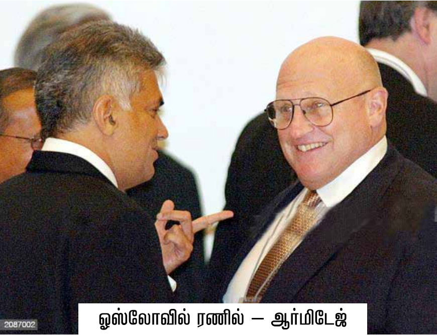
ஓஸ்லோவில் ரணில் - ஆர்மிடேஜ்

ஒழுங்குகள் செய்யப்பட்டன. அதற்கு விடுதலைப் புலிகளுக்கு அழைப்பும் விசாவும் அமெரிக்காவால் தரப்படவில்லை. அதற்குக் கூறப்பட்ட முதன்மைக் காரணம் அவர்கள் அமெரிக்காவின் பயங்கரவாதிகள் பட்டியலில் உள்ளனர் என்பதே.