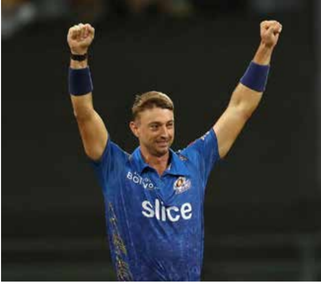
மும்பை, மே 14

97 ஓட்டங்களுக்கு சுருண்ட சென்னை அணியை 5 விக்கெட்களால் வெற்றி கொண்டது மும்பை இந்தியன்ஸ் அணி. இந்த தோல்வியால் சென்னை அணிக்கு சுற்று குறைவாக இருந்த இறுதிச்சுற்று வாய்ப்பையும் மும்பை அணி தகர்த்தது.