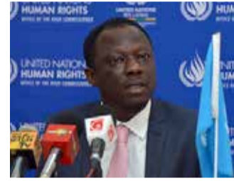
கைதுகள் உள்ளடங்கலாக ஆர்ப்பாட்டங்கள் முடக்கப்பட்டுள்ளமை

தனது உத்தியோகபூர்வ ருவிட்டர் பக்கத்தில் செய்திருக்கும் பதிவிலேயே ஐ.நாவின் விசேட அறிக்கையாளர் மேற்கண்டவாறு கண்டனம் வெளியிட்டுள்ளார். "பொலிஸார் மற்றும் இராணுவத்தினருக்கு வழங்கப்பட்டுள்ள அவசரகால அதிகாரங்கள், மிதமிஞ்சிய படையினரின் பயன்பாடு, தன்னிச்சையான