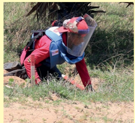
அவசியமாகும். கடந்த 2009ம் ஆண்டு யுத்தம் நிறைவு பெற்றதன் பின்னர் வடக்கில் உள்ள 640 கிராமங்களில் 105 மில்லியனுக்கும் மேற்பட்ட நிலக்கண்ணிவெடிகள் புதைக்கப்பட்டுள்ளன என்றும் அப்போது யுனிசெப் நிறுவனத்தினால் வெளியிடப்பட்ட செய்திக்குறிப்பில் தெரிவிக்கப்பட்டிருந்தமை குறிப்பிடத்தக்கது.