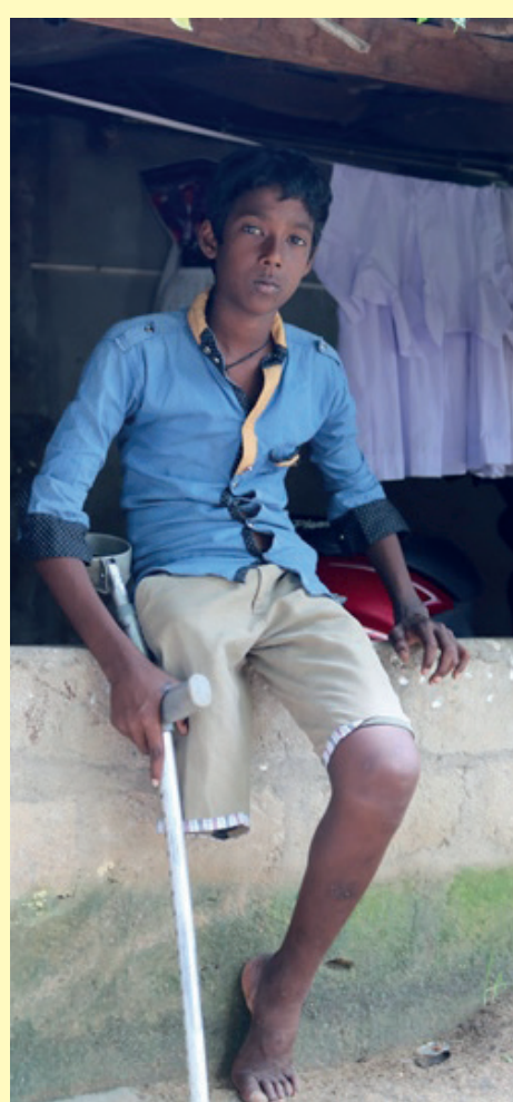
பலர் வெடிபொருட்களில் சிக்கி உயிரிழந்துள்ளதுடன் உடல் அவயவங்களையும் இழந்துள்ளனர்.

வெடிபொருட்கள் புதைக்கப்பட்ட பகுதியாகக் காணப்படும் இப்பகுதிகளில் பொதுமக்கள் செல்வதற்கு தடைவிதிக்கப்பட்ட பகுதியாக அடையாளப்படுத்தப்பட்ட போதும் அவற்றைப் பொருட்படுத்தாது அதற்குள் சென்று வெடி பொருட்களை எடுத்தல் மணல் அகழ்வுகள் மேற்கொள்ளாதல் என்பவற்றால் விபத்துக்களில் பலரும் சிக்கிக் கொள்கின்றனர்.