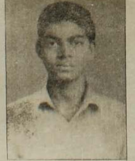
யாழ்ப்பாணம், ஜூன் 19 இவ்வாறு விடுதலைப் புலிகள் சேட்டுகின்றனர். (9-6)

முஸ்லிம்களின் அபிலாசைக்கு ஏற்ப அவர்களுக்கு தனிமாநிலம் வேண்டும். இதுவே புலிகளின் நிலைப்பாடு என்கிறார் திலகர்