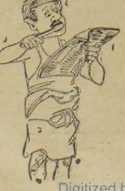
அப்ப உந்தி நோவரினா தம் தொந்திரி போலை