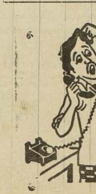
ஆயிச்சாரர் அரசியல் பக்கம் திரும்புகின்ற போல...!