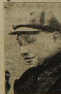
தெங் சியா சே பிங் சியாங்கேஷே (Chiang Kai-Shek) கம்யூனிஸ்ட் சீனா எதிர்ப்பு நடத்திய ஆயிரக்கணக்கான கம்யூனிஸ்ட் குகைப் படுகொலை செய்தார். அப்போதைய 'சோவியத்' அதிபராக இருந்த ஜோஸப் ஸ்டாலின் அந்நேக கண்டிக்க வில்லை.