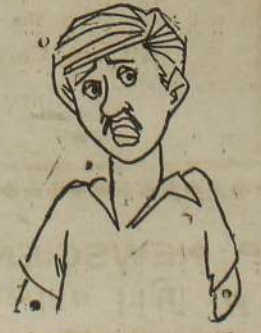
விசாரணை முடிவு ஆட்சி காலமும் முடிந்தது இவரும் பாருக்கோ.....!

"சார்க்" நாடுகளின் பெயரில் இலங்கைக்கு அமைதிப் படை கொழும்பு, ஏப் 16 கொழும்பு, ஏப் 16 "சார்க்" நாடுகளின் அமைதிப் படை என்ற பெயரில் இலங்கை அரசுக்கு உதவி வழங்க இந்தியா தீர்மானம் எடுக்கக்கூடும். "சார்க்" நாடுகளின் அமைதிப் படை முச்சந்தி முரளி