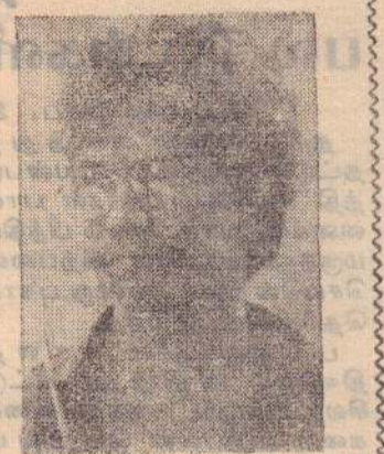
உண்ணுநீர் மறுத்து உடல் உயிர் உழைவற்றி மண்ணுனார் மதிமயங்க மாற்றோர்கள் கதிசலங்க கண்ணுநீர் வெற்றிக் காய்ந்த தமிழீழப் புண்ணில் புனுகிடும் புகழாரம் பூண்டோய்-நீ

தன்னுயிர் பேணத் தகாதன செய்யும் மன்னுயிர் வாழும் மாநில மகனில் இன்னுயிர் நீத்தும் எம்முயிர் காத்த இளையோர் பல்வோர் இறவா தவரே கண்ணீர் வற்றிக் காய்ந்த தமிழனைச் செந்நீர் பாய்ச்சிய தீரரும் பலவே, உண்ணீர் மறுத்து உயிரினை நீத்த மாணங்காத்தான் ஒரு மறக்குடி மன்னன் அவருள் இவனோர் தலைமகன் தமிழன் யாரென வினவும் பாரெலாம் பரவிப் புறநூலாற்றுக்குப் புத்துரை புனைந்தோன் அகநூலாற்றை அணுகா கிருந்தோன் தாளாண்மை மிக்க தாயின் வயிற்றில் வேளாண்மை மிக்க வேள்வித் தலைவன் உற்றான்; உறவினன்; உலவாத் தோழன் கற்றான்; கல்விப் பயனெலா மொருங்கே பெற்றான்; பெற்ற பெருந்தாய் புதல்வன் வன்சன் மறப்போர் அஞ்சா நெஞ்சால் மென்சன் அறப்போர் ஆற்றிய தலைவன் காந்தி காட்டிய வழிக்கொரு புதுப்பொருள் வாழ்ந்து காட்டிய வயதில் இளையவன் அன்பு வழிக்கெமை ஆற்றுப்படுத்திய நண்பன்; நல்லூர்க் கந்தன் கழலிணைத் தண்ணீர் உண்டு தாகந் தணிந்தவன் சாவை அணைத்துச் சங்கமமாகிச் சாவை வென்ற சாகாத் தலைவன் மக்கட் பெருங்கடல் குன்னுள் ஒரு துளி தானென உணர்ந்து தன்னைக் கரைத்தவன் பேருக்கும் என் பிறந்த ஊருக்கும் சிறப்புத்தந்த சிறுமுதுக் குறைவன் பார்த்தீபன் தலைபன் பண்பால் ஊரெழுச் செம்மண் சன்றசெந் தமிழன் தானே