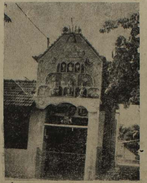
ஸ்ரீ நாகவரத நாராயணர் ஆலய முகப்புத் தோற்றம் படப்பிடிப்பு: 'கண்ணன்'

கடையே, அருணகிரிநாத சுவா மிக்கு முருகன், "கம்மாவிரு" என்ற உபதேசமால் வழிகாட் டினாரம். பெற்றுகரிய பிறவியாகிய கடையே, அருணகிரிநாத சுவா மிக்கு முருகன், "கம்மாவிரு" என்ற உபதேசமால் வழிகாட் டினாரம். பெற்றுகரிய பிறவியாகிய