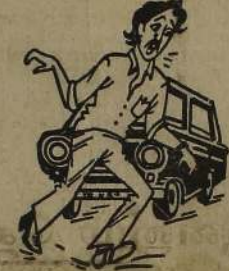
அடகு வைச்ச நகையளை அடை வைச்ச நகை என்று நினைச்சுத் திருப்பிக் குடுக்காம இருக்கினம் போலையே...